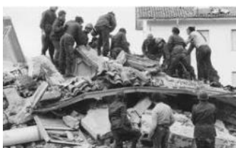
Immagine delle operazioni di soccorso

tendopoli impiantate per l'alloggiamento di 24.100 persone; cinquantadue posti di distribuzione di pasti caldi per un totale di 47.600 persone vettovagliate; 50.450 persone assistite con riforni