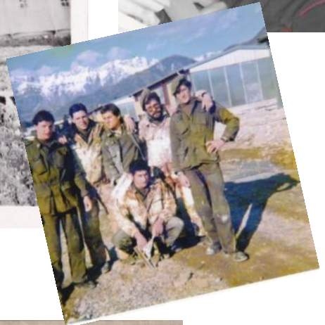
Riconoscimento ai soldati della Mantova per il generoso impegno dopo il terremoto